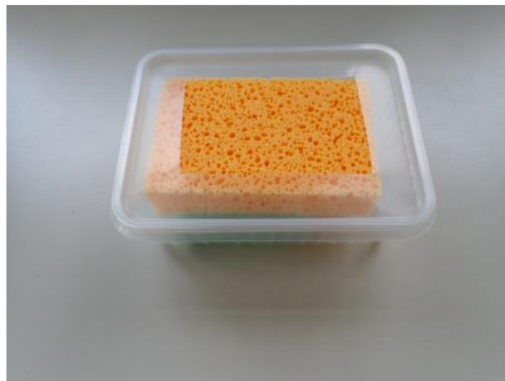
Figure 3 - Dispositif de distribution de l'attractif liquide.

Il est bon de rappeler les conseils suivants :