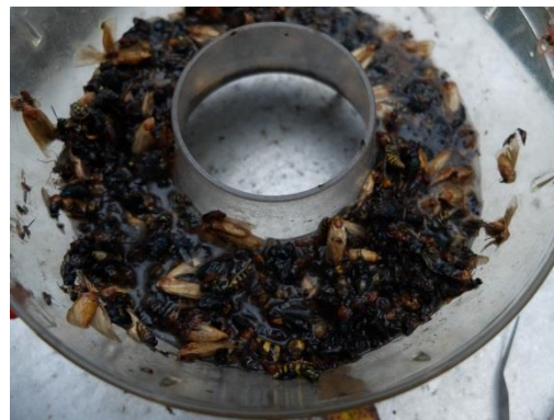
Figure 1 – Captures de pièges à noyade non sélectifs.

Vu ce problème de sélectivité, le CRA-W va tester cette année dans le cadre de Bee Wallonie des pièges à sec comme le Red trap ® ou le Belgian trap ® (Figure 2). Ces pièges devraient être plus sélectifs en permettant aux espèces non ciblées de s'en échapper. Si vous décidez d'utiliser ce type de piège dont la sélectivité n'est pas encore connue, il est important de le relever si possible quotidiennement afin de libérer les espèces non ciblées qui auraient été capturées. Il faut être aussi attentif à l'attractif utilisé qui doit être disposé de telle façon qu'il évite toute noyade des insectes visitant le piège. Dans ce but, vous pouvez tout simplement verser l'attractif dans une barquette munie d'une éponge (Figure 3). L'attractif testé par le CRA-W sera composé de 250 ml grenadine, 230 ml d'eau et 20 ml de vinaigre.